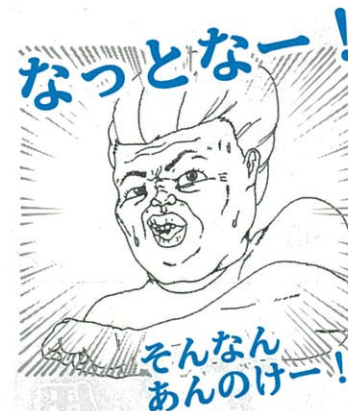
(注)↑驚いているえっちゃんです