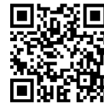
利用申請フォーム

URL: https://logoform.jp/form/QmXN/608275