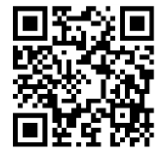
利用後アンケート フォーム

URL: https://logoform.jp/form/QmXN/608401