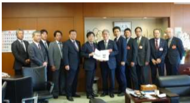
R1.11.21 国土交通省への要望