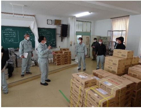
R5.1.18 若者定住対策について