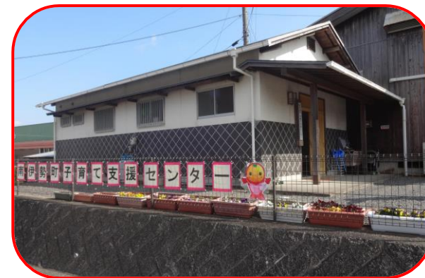
子育て支援センター