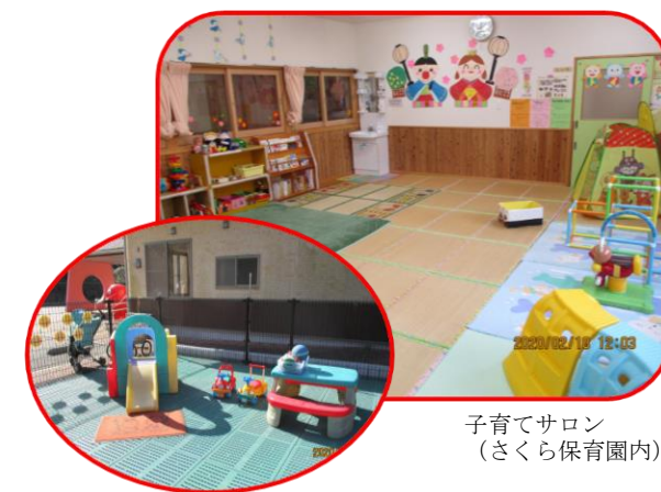
子育てサロン (さくら保育園内)