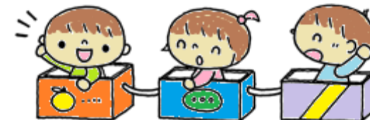
戶外遊び場 「おひさまひろば」