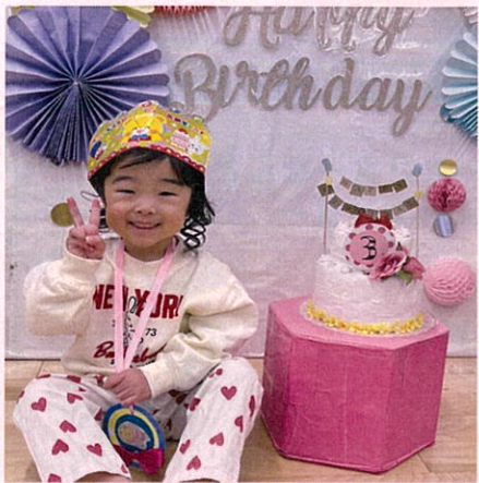
1月生まれのお友だち♡