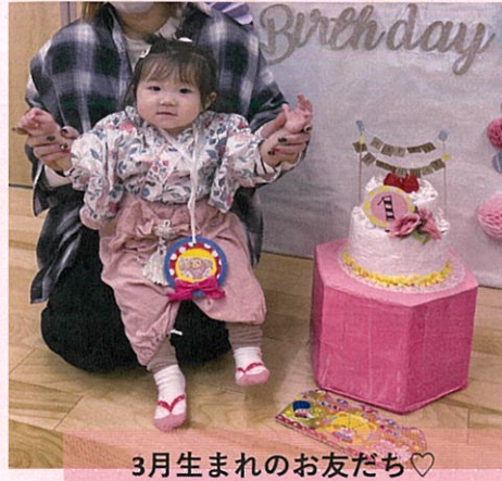
3月生まれのお友だち♡