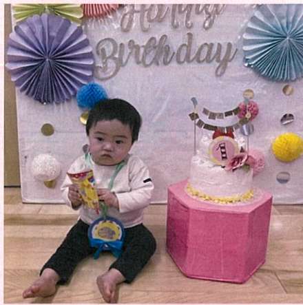
2月生まれのお友だち♡