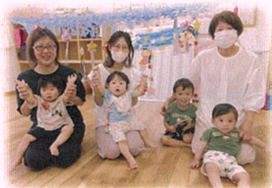
昨年度の様子です

※8月のふれあい広場(夏祭りごっこ) サロン3日、センター4日を予定しています。