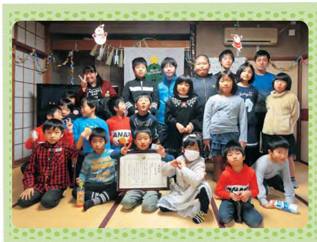
古和浦親子防災の会の子どもたち

「今後どのような活動をしていきたいか？」 昨年、1次避難場所へは避難袋を、2次避難所へは生活用品を収納ケースに入れ、約9割世帯の備蓄を行いました。これで何も持たずに高台へ避難することができ、とても安心です。次は、避難所運営訓練を行いたいと思っています。非常時であっても、みんながパニックにならずに生活できる環境を作っていきたいと考えています。