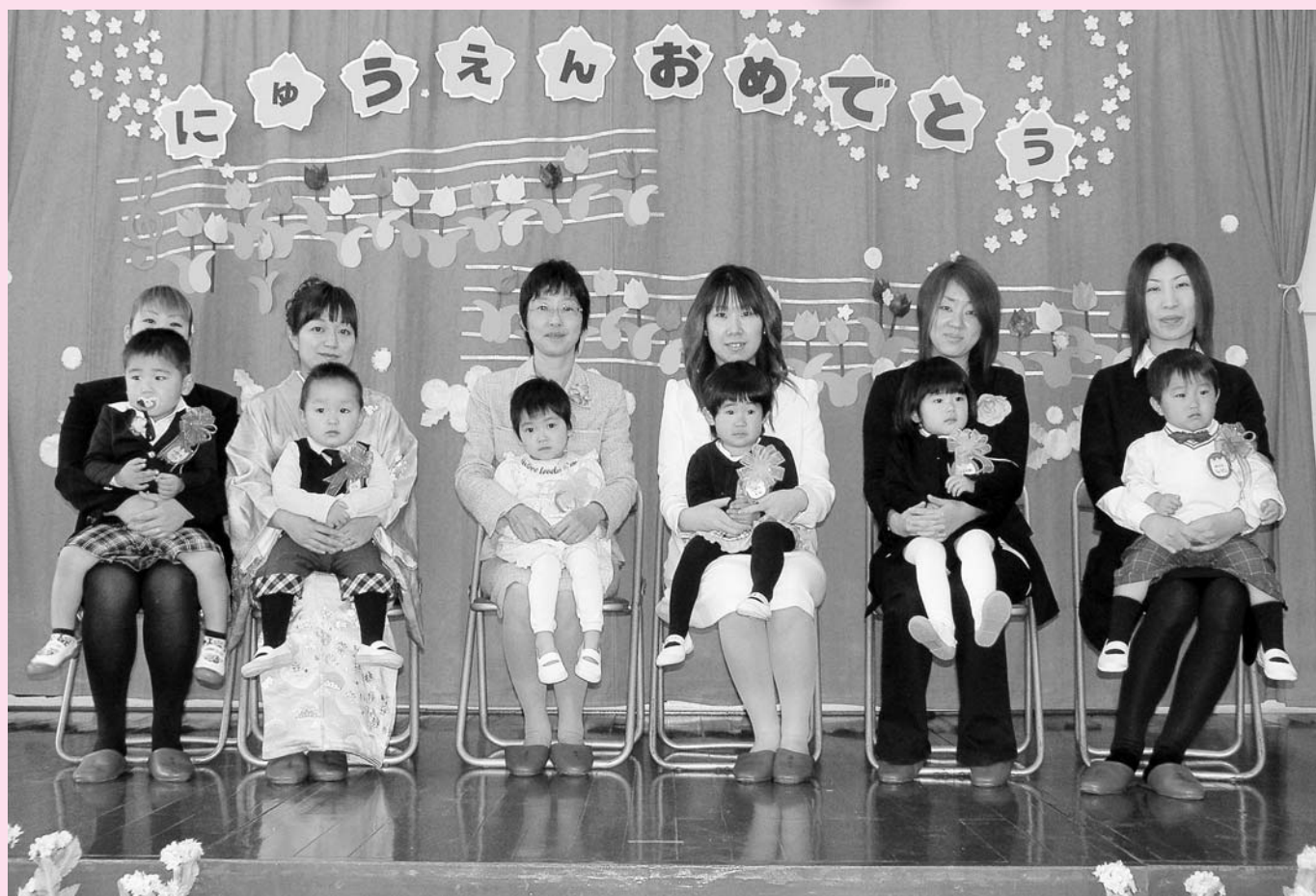
さざ波園入園式 (6人のかわいい新入園児たちは、大きな声でお返事ができました！)