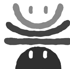
「 うま 美し国おこし・三重」 シンボルマーク

「 うま 美し国おこし・三重」実行委員会では、平成21年から平成26年まで、地域における「絆」づくりに取り組むグループや、地域の資源を活用して付加価値づくりに取り組むグループの皆さんを応援します。その一環として座談会を6年間にわたって開催していきます。座談会では、住民の皆さんが地域の課題やビジョンについて話し合い、専門家と一緒にその解決策や方向性を考えていきます。既に地域づくりの活動を行っている方や、これから始めようとお考えの方、また、グループの活性化にお悩みの方などお気軽にご参加ください。