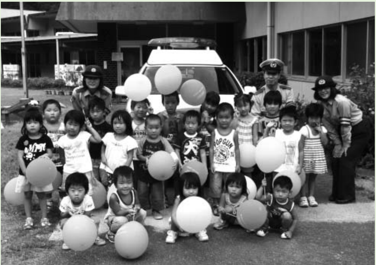
交通安全パレード（さざ波園）